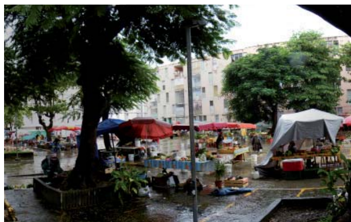
place utilisée pour le marché Man Réau (Pointe-à-Pitre)

L'appropriation sociale de la Nature en Ville peut être favorisée aussi par le dépassement du « beau » et l'intégration de « l'utile » dans les plantations urbaines. Cela peut se traduire notamment par la création de vergers urbains, renouant avec la fonction nourricière des plantes qui persiste encore en milieu rural (jardin créole) ou dans les « jardins de cases » à l'arrière des maisons de ville (espace privé). Les usages de cueillette persistent aux Antilles et se constatent aux bords des routes ou dans les espaces périurbains. La question est donc de savoir comment la ville peut laisser l'arbre fruitier occuper une place sur l'espace public. La contrainte d'entretien et de propreté des surfaces minérales imposent des précautions d'implantation ou de gestion sur les places publiques ou les trottoirs. En revanche, les possibilités restent entières sur les pelouses par exemple.