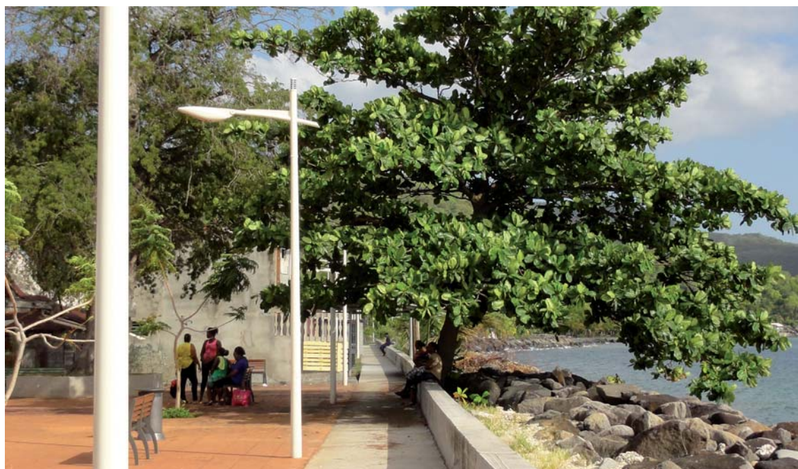
place publique alliant conservation du patrimoine arboré traditionnel et ombrage (Pointe-Noire)