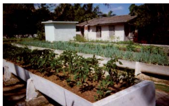
agriculture urbaine (Cuba)