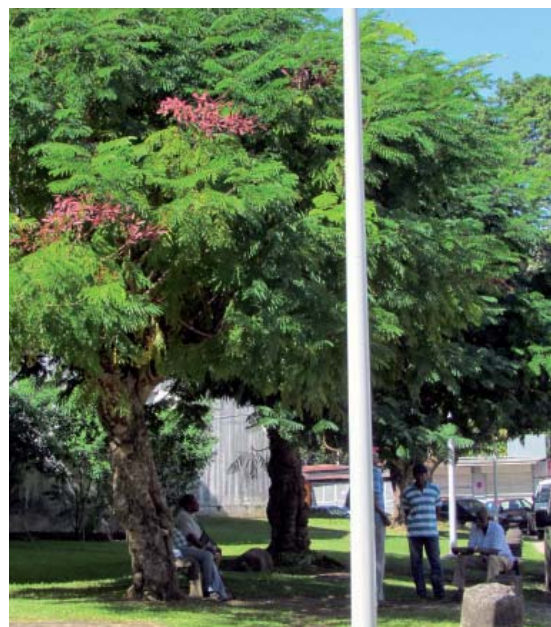
sénat des anciens, à l'ombre d'un grand arbre

A Trois-Rivières, le parc de la résidence Alloua Touna est à la fois destiné aux locataires des nouveaux logements de la SIKOA construits sur cette parcelle mais aussi à l'ensemble de la population du bourg qui peut s'y promener dans un cadre boisé, y profiter de la vue sur les Saintes, mais aussi y pratiquer la pétanque, jouer aux dames ou s'essayer aux agrès sportifs installés dans le cadre du programme régional de P3S (Parcours Sportif de Santé Sécurisé).