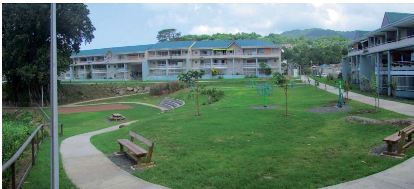
le parc Alloua Touna (résidence Bellemont à Trois Rivières - SIKOA), accessible aussi bien aux locataires qu'à la population locale